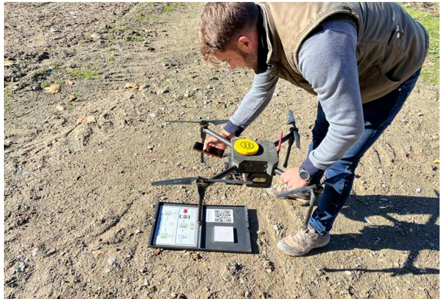
FIGURA 2 Calibración del dron equipado con cámara multiespectral antes del vuelo mediante paneles de referencia, utilizada para estimar índices vegetativos en cultivos biofumigantes.

condiciones locales y los ciclos de cultivo. La selección de especies biofumigantes efectivas se basó en tres factores clave: la capacidad de producción de biomasa, la concentración y el perfil de glucosinolatos (GSL), y la adaptación a condiciones climáticas locales.