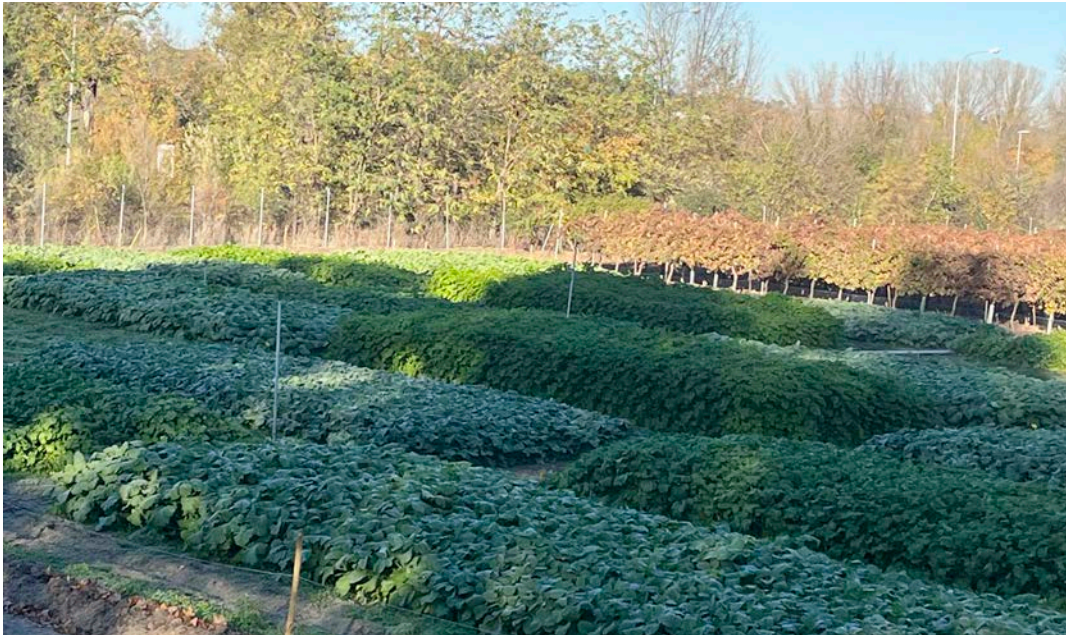
FIGURA 1 Vista general de las parcelas experimentales de especies biofumigantes en los campos de ensayo de la Universidad Politécnica de Madrid.